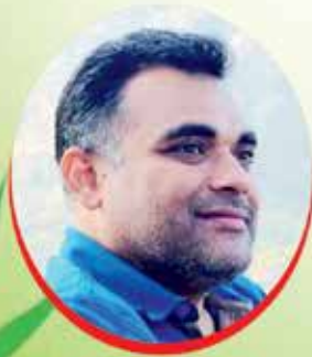
નીશિથ આનંદ ઈંડ