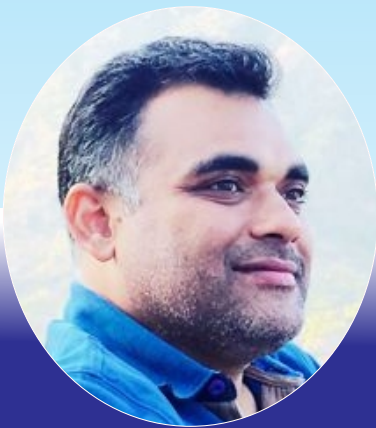
નીશિથ આનંદ દંડ

Sure Safety ® Complete Safety Solutions PPE Training Consulting & Services