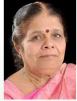
લીલાબેન સનત ખોના ગામ - જખૌ

પરબ એટલે તરસ્યાનો વિસામો, રણમાં મીઠી વીરડી, પરબ એટલે કેડીઓ બહેનોને આર્થિક સંકળામણમાં એમનો હાથ ઝાલી એમને આત્મનિર્ભર કરતો એક મજબૂત હાથ. આમ પરબ શક્તિ સંજીવની કેડીઓ સમાજની દૂરદર્શી બહેનોએ બહેનોની અંદર સમાયેલી શક્તિ, સામર્થ્ય અને કૌશલ્યનો પરિચય કરાવી એટલું પ્રોત્સાહન માત્ર નથી આપ્યું પણ અમારા માટે હકીકતમાં “પરબ” નામનું પ્લેટફોર્મ ઉભું કર્યું, જ્યાં અમે અમારા હસ્ત કૌશલ્યનો ઉપયોગ કરી પરિવારને આર્થિક ટેકો આપી ખરા અર્થમાં પરબે અમને સમાજમાં વ્યાવસાયિક મહિલાનો દરજ્જો અપાવ્યો.