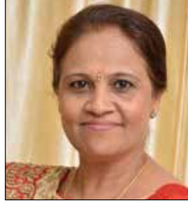
ભારતી ગૌતમ દંડ ઉપવાસ - ૯