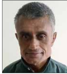
દિપક નવીનચંદ્ર મોમાયા ઉપવાસ - ૯