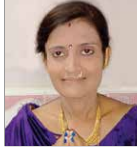
પાડલબેન વિતીન મોમાયા માસ ક્ષમાણ-૩૧ ઉપવાસ