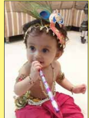
પર્વ જીગર મૈશેરી