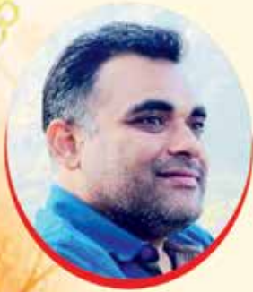
નીશિથ આનંદ દંડ

Sure Safety ® Complete Safety Solutions PPE Training Consulting & Services