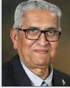
ઠાકરશી મેઘજી ગોસર તા.૦૭ ઓક્ટો. (ઉ.૮૪) બાયઠ-ઘાટકોપર