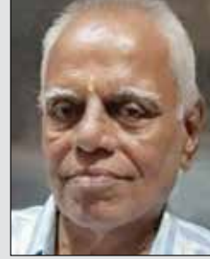
વિનોદલાઈ હરપાર ધરમશી તા.૧૬ ઓક્ટો. (ઉ.૭૫) જખૌ-મુલુંડ