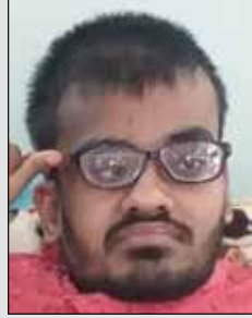
ચિંતન કિરીટ મોમાયા તા.૧૮ ઓક્ટો. (ઉ.૨૪) બારોઈ-જલગામ