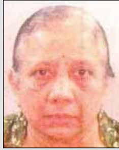
તજ્જશીલા મેઘજી ધરમશી તા.૨૩ ઓક્ટો. (ઉ.૭૨) ગોરખડી-તાડદેવ