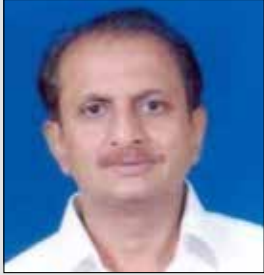
બીમજી લોડાયા તા.૨૭ નવે. (ઉ.૭૦) જખો-ડોંબિવલી