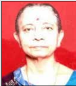
નવલબાઈ ધરમશી તા.૨૫ નવે. (ઉ.૮૨) સુથરી-દાદર(ઈ)