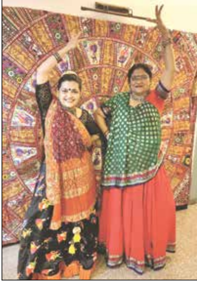
ફર્સ્ટ વીનર - સાસુ વલુની જોડી