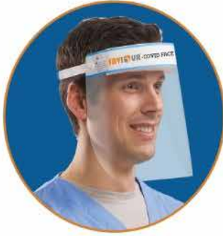
COVID-19 Face Shield