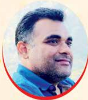
નીશિથ આનંદ ઈંડ

Sure Safety ® Complete Safety Solutions PPE Training Consulting & Services