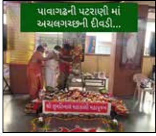
પાવાગઢની પટરાણી માં અચલગચ્છની દીવડી...