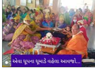
એવા ધૂપના ધૂમાડે વહેલા આવજો...