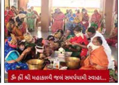
ૐ હ્રી શ્રી મહાકાલ્યે જલં સમર્પયામી સ્વાહા...