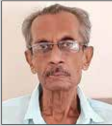
જીનેન વ્હી. લોડાયા તા.૨૮ ફેબ્રુઆરી (ઉ.૬૩) તેરા-મીરા રોડ