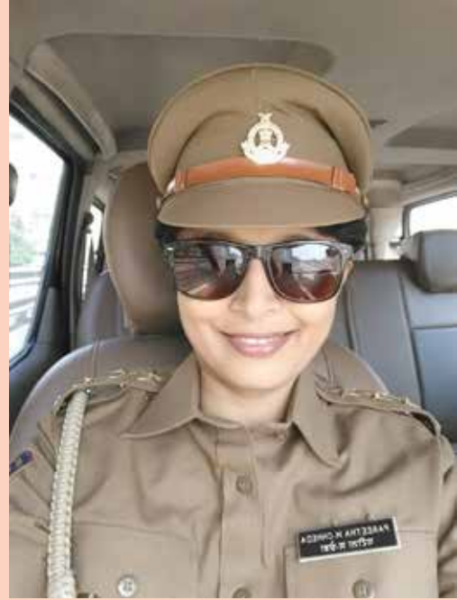
પરીથા મનિષ છેડા

However, in this long journey of mine, I am yet to meet a fellow officer from our KDO in this Department. I really feel bad about it. I wish that more awareness is created among people in our community about the numerous job opportunities available in Government sector which give prestige to us. And I sincerely hope that youngsters of our Community prepare hard and appear for the various competitive exams held for the Government jobs.