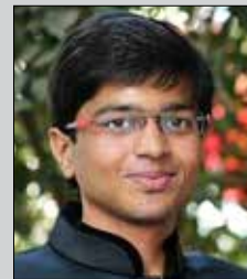
કેવલ લોડાયા તા.૬ માર્ચ (ઉ.વ.૩૦) મોટી સિંધોડી-રાયપુર