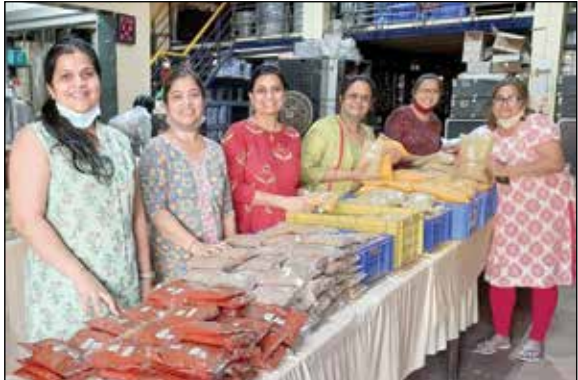
મસાલા વિતરણ કાર્યક્રમ