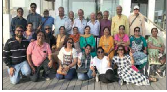
બિદડા નેચર કેમ્પ (સીઝન - ૨)માં સહભાગી થનાર જ્ઞાતિજનો