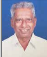
પુનશી એલ.માલદે તા.૭ એપ્રિલ (ઉ.૮૪) દલતુંગી-મુલુંડ