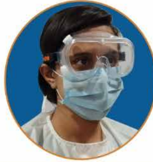
Chemi Splash Small

*Offer Valid till Stocks last!!! at factory Prices.