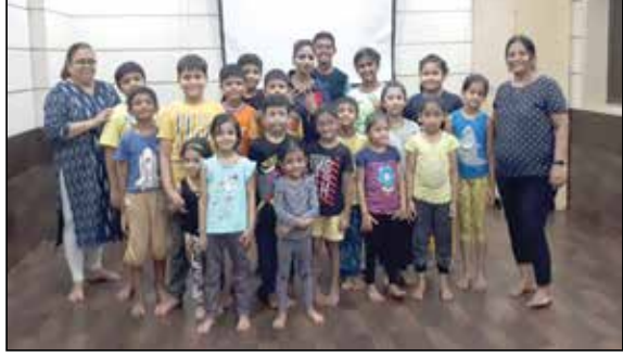
કિડ્સ સ્પેશીયલ યોગા કાર્યક્રમ