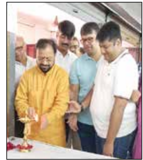
કચ્છ યુવક સંઘના સથવારે યોજાયેલ પ્લસ ડોનેશન કેમ્પ ૨૦૧૮