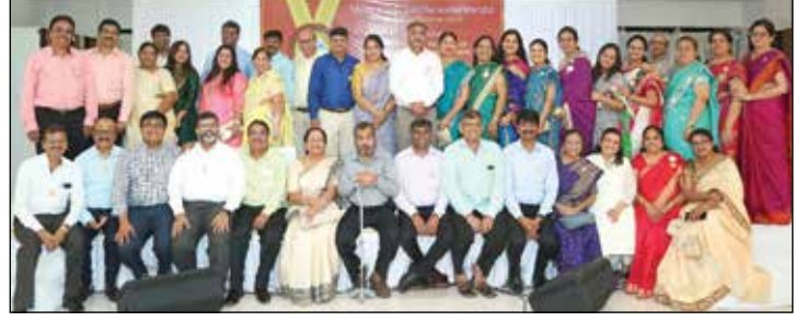
સરસ્વતી સન્માન કાર્યક્રમ ૨૦૧૯