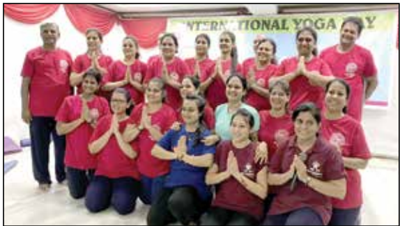
ઈન્ટરનેશનલ યોગા દિવસની ઉજવણી