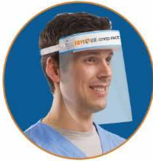
COVID-19 Face Shield