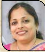
ભારતી ડોલર લોડાયા કમિટી મેમ્બર (સુથરી)