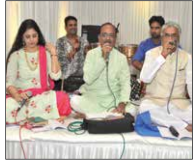
શ્રી ક.દ.ઓ. સર્વોદય મંડળ દ્વારા ગોલ્ડન જ્યુબીલી કાર્યક્રમ - મહાકાળી માતાજીની ભાવના