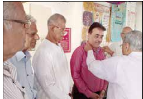
બલસાણા, પારોલા અને દેવલાલી તીર્થ દર્શનનો કાર્યક્રમ