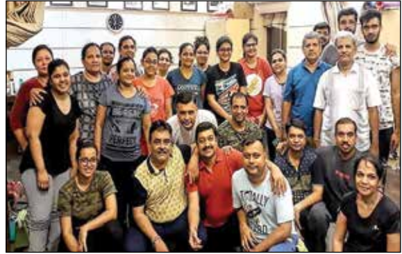
હેલ્થી કેડીઓ સેશન કાર્યક્રમ