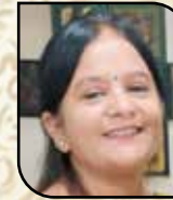
છાયા મહેશ દંડ કમિટી મેમ્બર (સાંઘવ)

અભિનંદન... અભિનંદન... અભિનંદન... અભિનંદન