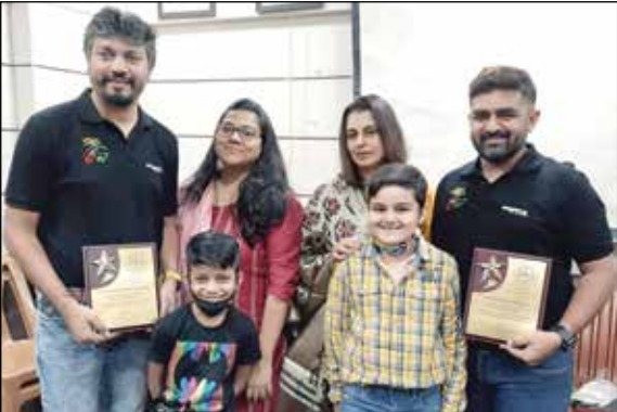
સાહસિક સાયકલવીર યુવાનોનો સત્કાર