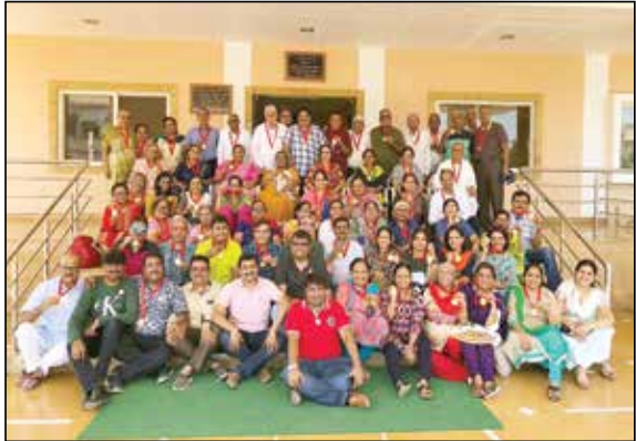
બિદડા નેચર કેમ્પ (સીઝન - ૧)માં સહભાગી થનાર જ્ઞાતિજનો