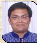
ડાયમંડ અશોક ઈંડ કો.ઓપ્ટ (વરાડીયા)