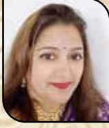
કાશ્મીરા પ્રેમ ચુરલા સેક્રેટરી (સાંઘાણા)