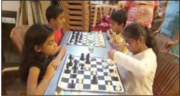
બાળકો માટે ઉપલબ્ધ કરાયેલ રમત ગમતના સાધનો