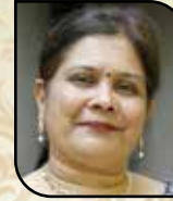
હેતલ મચુર લોડાયા કમિટી મેમ્બર (ભાંડીયા)