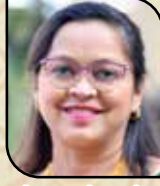
સેજલ ચિંતન દંડ જોઈન્ટ સેક્રેટરી (સુથરી)