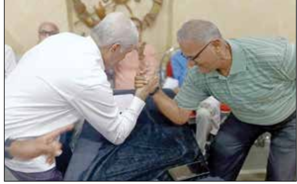
બચપન કી યાદે કાર્યક્રમ