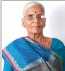
નવેલબેન એન.મૈશરી તા.૮ એપ્રિલ (ઉ.૮૦) લાલા-ડોંબિવલી