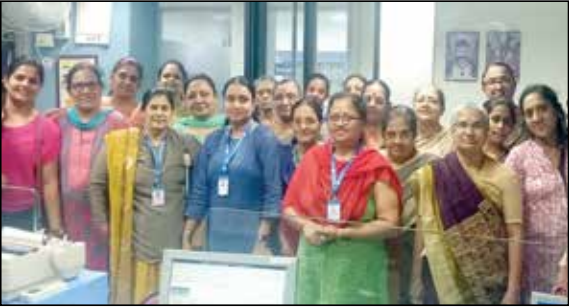
મહિલાઓ માટે બેન્કીંગ માહિતી સેમિનાર