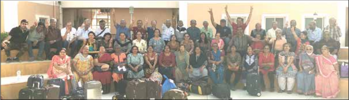
બિદડા નેચર કેમ્પ (સીઝન - ૫)માં સહભાગી થનાર જ્ઞાતિજનો