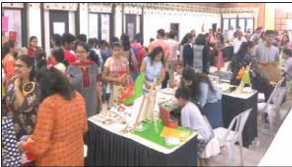
બાળકો માટે કિડ્ઝીબીશન કાર્યક્રમ