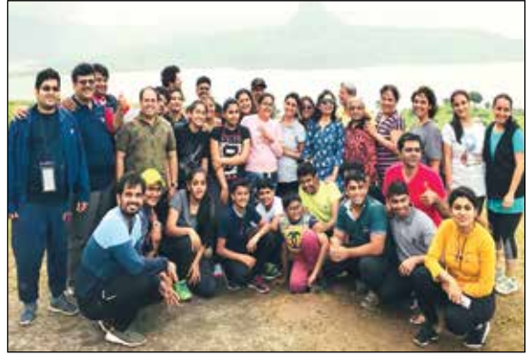
તીકોના ગઢ (પાવને લોનાવલા) ટ્રેકીંગ કાર્યક્રમ