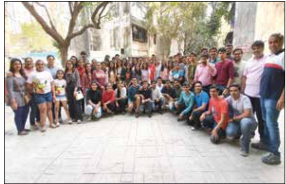
યુથ ટ્રેઝર હન્ટ કાર્યક્રમ