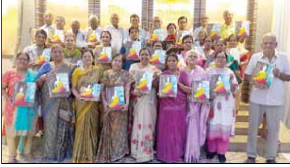
વડિલો માટે યોજાયેલ પેન્ટોલોજી કાર્યક્રમ