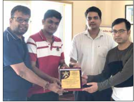
રતનવીર ખાતે ડૉક્ટર ટીમને સન્માન પત્ર અર્પણ