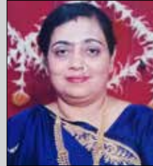
હીરા હંસરાજ છોડા તા.૭ એપ્રિલ (ઉ.૬૫) નલિયા-ઘાટકોપર