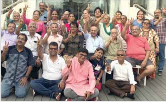
બિદ્ડા નેચર કેમ્પ (સીઝન - ૩)માં સહભાગી થનાર જ્ઞાતિજનો