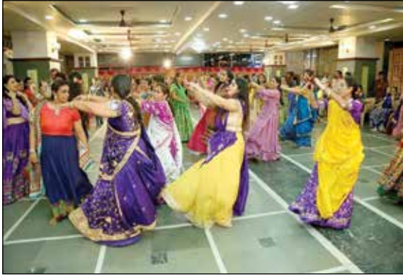
મહિલા સ્નેહમિલન કાર્યક્રમ ૨૦૧૯