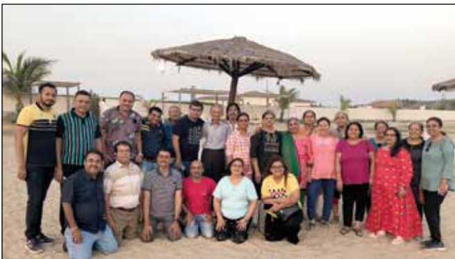
બિદ્ડા નેચર કેમ્પ (સીઝન - ૪)માં સહભાગી થનાર જ્ઞાતિજનો