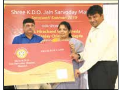
નીવ તેમજ પ્રિ વીલેજ કાર્ડની શરૂઆત