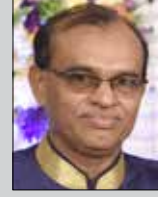
તિલક ખોના તા. ૧૧ એપ્રિલ મોટી ખાવડી-મુલુંડ