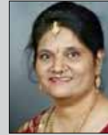
ડીમ્પલ ડાઘા તા. ૧૪ એપ્રિલ (ઉ.૫૩) વરાડીયા-થાણા