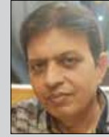
ઉત્તમ ડાઘા તા. ૧૨ એપ્રિલ (ઉ.૫૭) દલતુંગી-ડોંબિવલી