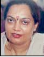
રંજન લોડાયા તા. ૧૧ એપ્રિલ (ઉ.૭૧) ગોરખડી