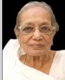
તિલકસુંદરી લોડાયા તા.૨૦ સપ્ટે.(ઉ.૯૩) સુથરી-માટુંગા