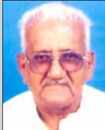
રામજી બોના તા.૨૦ સપ્ટે.(ઉ.૮૫) નલિયા-ઘાટકોપર