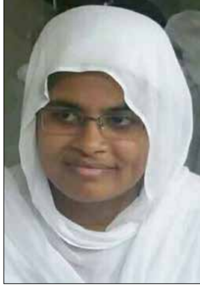
પ.પૂ.સા.શ્રી મલ્લિગુણાશ્રીજી મ.સા.