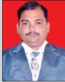
હિરેન લોડાયા તા.૨૨ ડિસે. (ઉ.૪૦) સાંધવ-સાંધવ