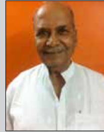
મુરજી લોડાયા તા.૨૪ ડિસે. (ઉ.૮૭) કોઠારા-મલાડ