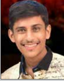
હિત દંડ તા.૧૯ ડિસે. (ઉ.૨૧) સુથરી-ડોંબિવલી