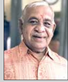
કિરીટ દંડ તા.૨૧ ડિસે. (ઉ.૬૮) સાંધણ-માટુંગા