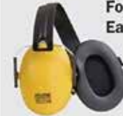
Saviour Foldable Ear Muffs