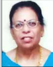
હીરાવંતી દંડ તા. ૧૯ જાન્યુ. લાલા-કાંકરોલી