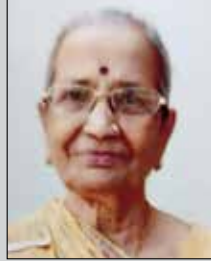
હિરાવંતી લોડાયા તા.૨૩ જાન્યુ. (ઉ.૮૦) આરીખાણા-ધૂલિયા