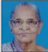
પાનબાઈ લોડાયા તા.૩ માર્ચ (ઉ.૯૦) દલતુંગી-વડાલા