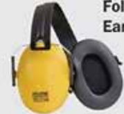
Saviour Foldable Ear Muffs