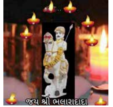
જય શ્રી ભલારાદાદા

અબડાસા પંથકના ઐતિહાસિક નગર તેરા નગરના શ્રી ભલારાદાદા મંદિરની નૂતન ધ્વજા વૈશાખ સુદ પને ગુરૂવાર તા.૫ મે ૨૦૨૨ના દિવસે છે. એ મંગલ દિને ધ્વજને પહેડી પ્રસંગે દાદાના સ્થાનકે પધારવા સર્વે ભાવિકોને હાર્દિક નિમંત્રણ છે. ઘજા અને પહેડી પ્રસાદના દાતા લાભાર્થી બનવાનું સંપૂર્ણ લાભ લેવા ઈચ્છા ધરાવનાર ભાવિકોને પહેડીનો નકરો અંદાજિત રૂ. ૬૦૦૦/- આવશે. જે માટે વહેલો તે પહેલોના ધોરણે નામ નોંધણી થશે.