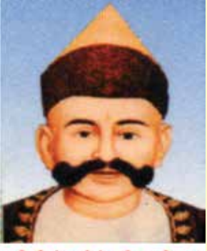
જ્ઞાતિ શિરોમણી શેઠશ્રી નરસી નાથા