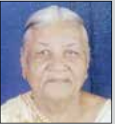
કબીબેન જવાણી તા.૨૬ ફેબ્રુ. (ઉ.૮૬) જખૌ-ડોંબિવલી