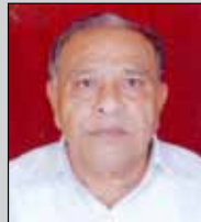
મણિકાંત લોડાયા તા.૨૮ એપ્રિલ (ઉ.૭૮) સાંયરા-વડાલા