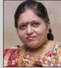
સરલા દંડ તા.૮ જૂન (ઉ.૬૦)સેવક સાંઘવ-ડોંભિવલી