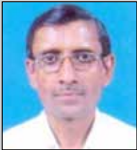
ધનપતિ લોડાયા તા.૧૩ જૂન (ઉ.૬૮) રવા-ડોબિંવલી