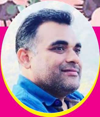
નીશિથ આનંદ દંડ

ડાહ્યો માણસ પોતે સાચો હોય તો પણ દલીલ કરતો નથી - જેમ્સ એલન