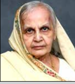
ઈન્દિરાબેન લોડાયા તા.૧૬ એપ્રિલ (ઉ.૮૪) રાપર-અહમદનગર