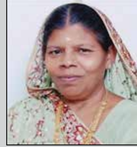
સગુણા લોડાયા તા.૨૧ એપ્રિલ (ઉ.૬૭) ખાવડી મોટી-ડોંબિવલી (પ)