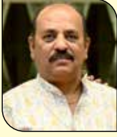
મહેશ લખમશી લાવશીલા (કોઠારા-ડોંબિવલી) ૧૬ ઉપવાસ