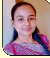
ઠાચા જયેશ લોડાચા (વાંકુ-ડોંબિવલી) ૧૧ ઉપવાસ