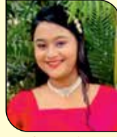
ચશી ભવૃર મોમાયા (સાંચરા-નાહુર) ૧૧ ઉપવાસ