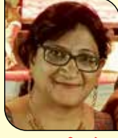
જીગ્ના જતીન મોતા (સુથરી-ડોંબિવલી) ૬ ઉપવાસ