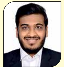
નિકુંજ કાર્તિક દંડ (સુથરી-મુલુંક વે) ૩૦ ઉપવાસ