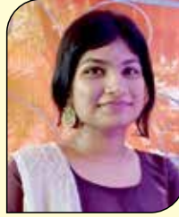
કિચા લાપસીયા (દલતુંગી-મુલુંક વે) ઉવસાગરમ તપ