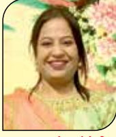
નૂતન ભાવેશ મૈશેરી (મોટી ખાવડી-ડોંબિવલી) ૬ ઉપવાસ