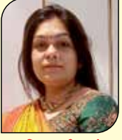
માલિકા જિરિશ દેસ (છાદુરા-મુલુંડ) ૬ ઉપવાસ