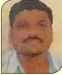
મહેશ લાપસીયા (દલતુંગી-મુલુંક વે) ઉવસાગરમ તપ