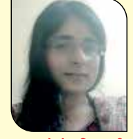
પાચલ હેમંત વિક્રમશી (સુથરી-ડોંબિવલી) ૬ ઉપવાસ