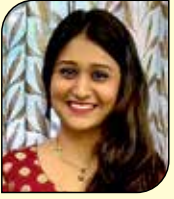
નિયતિ અવલ શિયાલ (જખૌ-મુલુંડ વે) ૧૬ ઉપવાસ