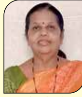
ધનલક્ષ્મી નવીન મોમાયા (સાંચરા-મુલુંડ વે) ૬ ઉપવાસ