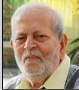
કુલિનકાંત લોડાયા તા.૬ ડિસેમ્બર (ઉ.૭૬) સુથરી-અગાસ