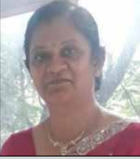
વીજ્જલબેન લોડાયા તા.૧૬ ડિસેમ્બર (ઉ.૫૩) સાંયરા-બેંગલોર