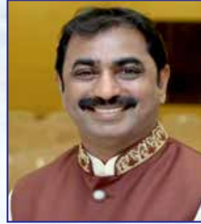
વાઈસ પ્રેસિડન્ટ વિરેન્દ્ર ભવાનજી લોડાયા