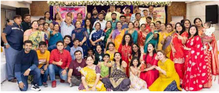
સંપૂર્ણ ટીમ મેમ્બરો