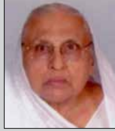
સોનબાઈ સોની તા.૧૪ ફેબ્રુઆરી (ઉ.૯૬) વાંકુ-વડાલા