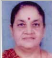
પચીનીબેન લોડાયા તા.૪ માર્ચ (ઉ.૮૩) સુથરી-મુલુંડ (૫)