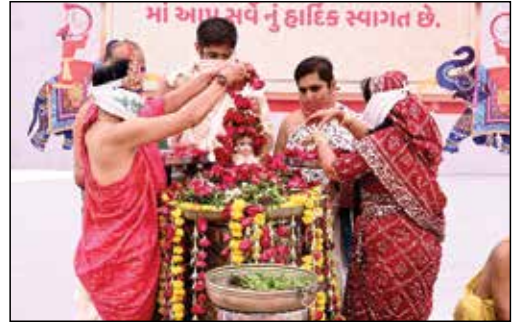
પુષ્પ અભિષેકના લાભાર્થી પરિવાર દિક્ષાર્થી પરિવાર