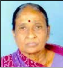
ધનબાઈ ખોના તા.૨૩ મે (ઉ.૭૫) સાંધવ-આદિપુર