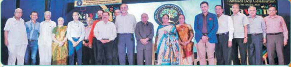
નવરંગ - ૨૦૧૯માં પદાચાર્ય ટ્રસ્ટીગણ, પદાધિકારી, દાતાશ્રી પરિવારો તથા આમંત્રિત મહાનુભાવો