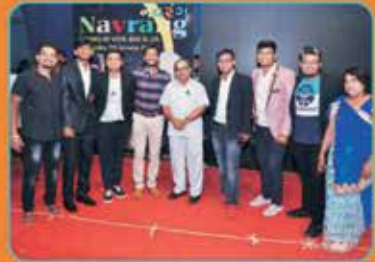
સાંસ્કૃતિક સમિતિના સભ્યો