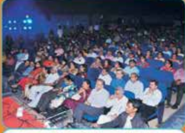
નવરંગ ૨૦૧૯ નિહાળતા પ્રેક્ષક વર્ગ