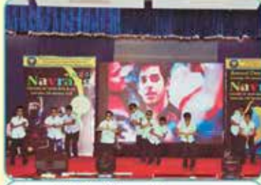
વી.એલ.વી.જી. કીડ્સ ડાન્સ