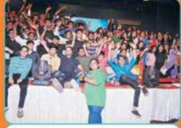
વી.એલ.વી.જી. બોઈઝ, એલ.વી.એલ. ગર્લ્સ ટીમ