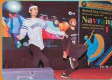
વી.એલ.વી.જી ડ્યુએટ ડાન્સ