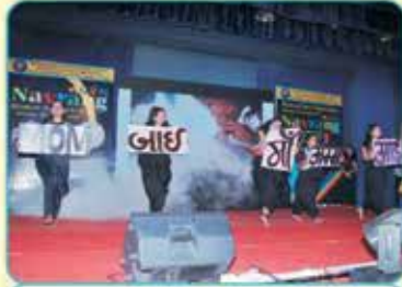
મધર ગ્રેટીટ્યુડ ડાન્સ