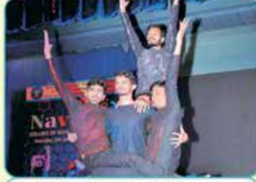
વી.એલ.વી.જી. રોબોટીક્સ ડાન્સ