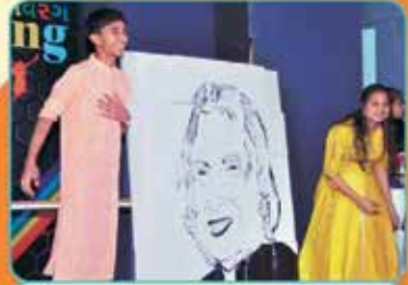
લાઇવ બોક્સ પેઇન્ટીંગ