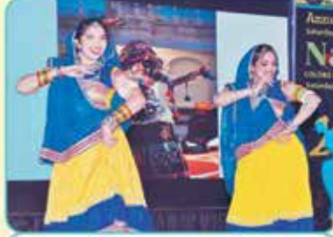
રાજસ્થાની ફોક ડાન્સ