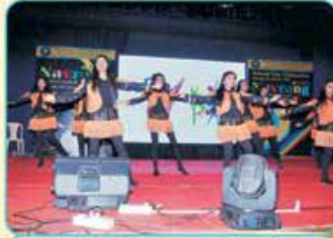
ગ્લોબલ વિલેજ - બેલે ડાન્સ