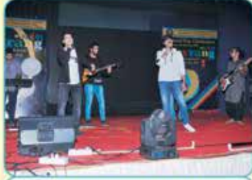
વી.એલ.વી.જી. બેન્ડ ઓફ બોય્ઝ