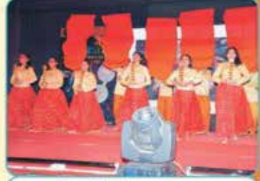
ગણેશ વંદના નૃત્ય