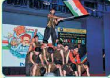
વી.એલ.વી.જી. જય હો! નૃત્ય