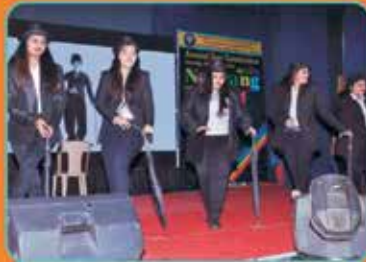
કન્યા છાત્રાલય - ચાર્લી ચેપ્લીન ડાન્સ