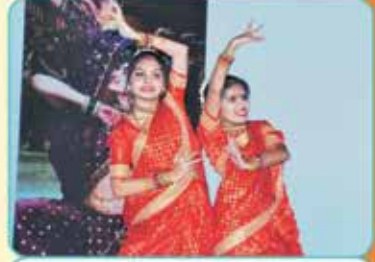
કન્યા છાત્રાલય - લાવણી નૃત્ય