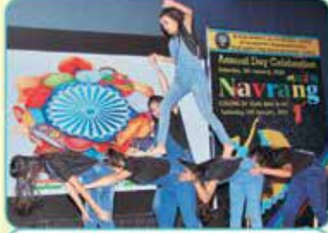
કન્યા છાત્રાલય-ગર્લ્સ સ્ટેજ