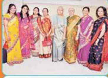
સંસ્થાના મહિલા પદાધિકારીઓ