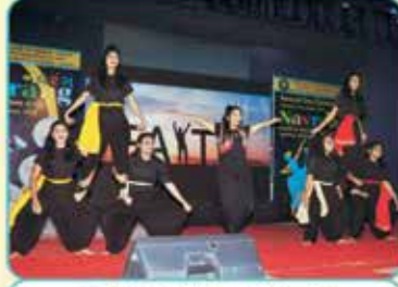
કન્યા છાત્રાલય - એટીટ્યુડ