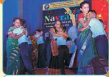
કિડ્સ - પેરેન્ટ્સ ડાન્સ