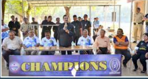
Chief Guest - Padmashri. Adv. Shri. Ujjwal Nikam