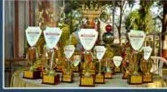
Trophies of Khelotsav-5