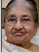
જ્યાબેન લોડાયા તા.૨૦ ડિસેમ્બર (ઉ.૯૦) નલિયા-અંધેરી