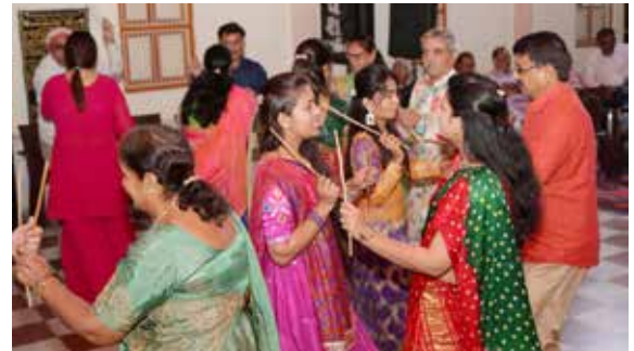
રાતે ભક્તિ તથા મટુકડી રાસ તથા ડાંડિયા રાસ