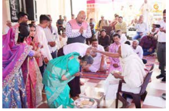
ગુરુ પૂજન લાભાર્થી પરિવાર તથા ગામવાસીઓ