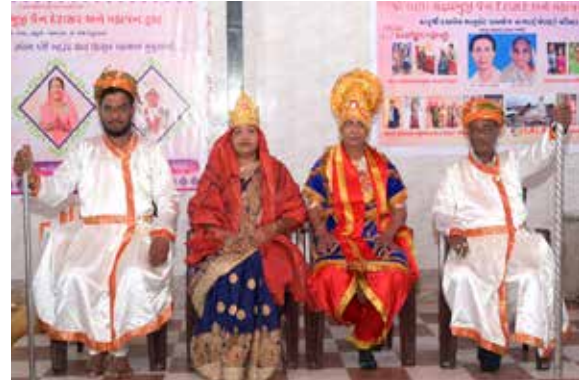
કુમારપાળ રાજાની આરતી