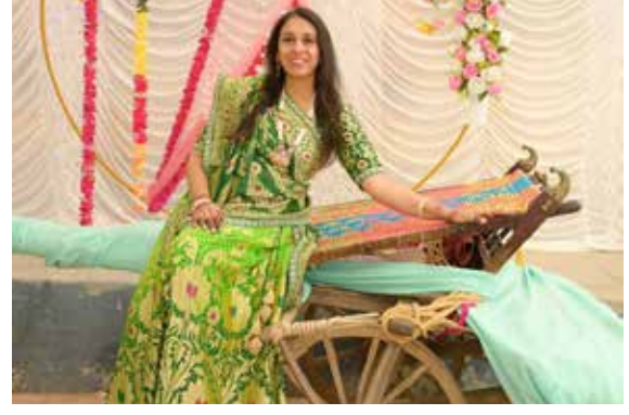
સેલ્ફી પોઈન્ટ મળા લેતા ગામ વાસી