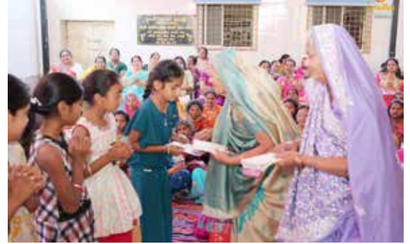
બારોટ સમાજની દીકરીઓ ને મ.સા જૈન ધર્મ જ્ઞાન પીરસાયુ