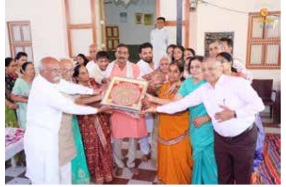
દાતા પરિવારનું બહુમાન