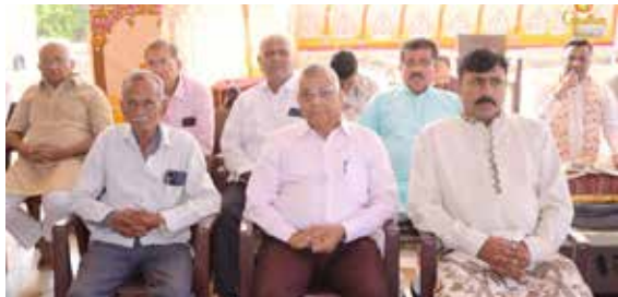
સત્તર ભેદી પૂજા તથા ધ્વજારોહણ