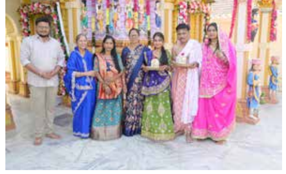
ચંદ્ર દર્શન તથા સૂર્ય દર્શન લાભ લીધેલ પરિવાર