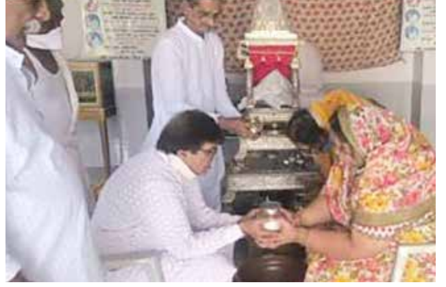
સ્નાત્ર પૂજા બાદ શાંતિ કળશ