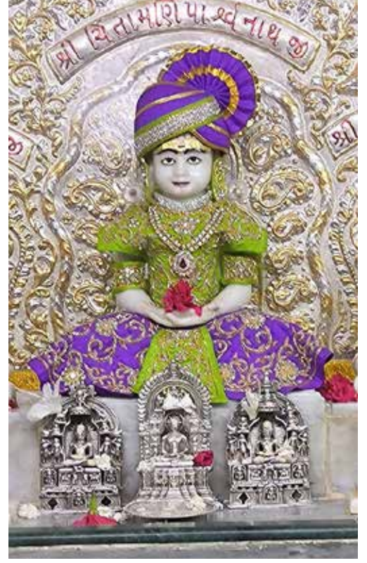
શ્રી ચિંતામણિ પાર્શ્વનાથ