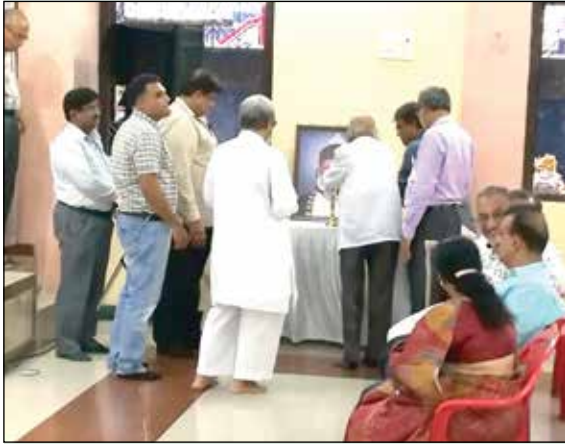
મહાનુભાવો દ્વારા દીપ પ્રાગટ્ય