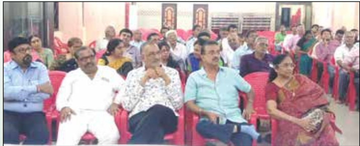
સભામાં ઉપસ્થિત જ્ઞાતિજનો