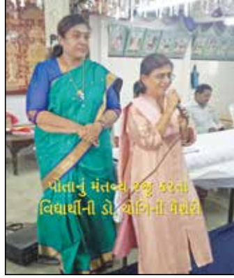
પોતાનું મંતવ્ય રજૂ કરતા વિદ્યાર્થીની ડો. એચિના પચૌકી