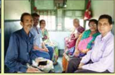
યાત્રિકો બાંદરા ટર્મિનલ