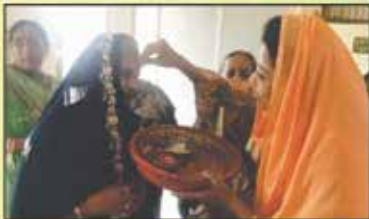
દાતા પરિવારની શ્રાવિકોઓનું તિલકથી સન્માન કરેલ