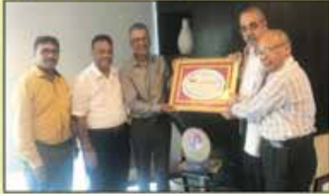
મુખ્ય દાતાશ્રી પરિવારનું બહુમાન