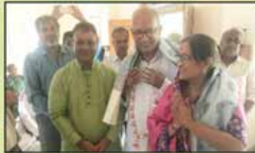
અષ્ટપ્રકારી સામગ્રીના દાતાશ્રીનો બહુમાન