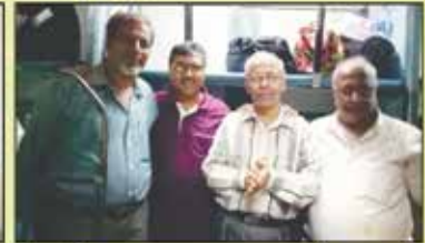
મિચ્છામિ દુક્કડમ કરતા મહાજનશ્રીના સભ્યો