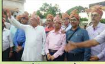
નરેડી - ભવ્ય સામૈયું