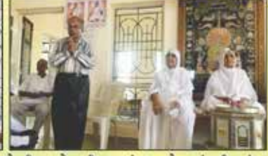
કોટડી મહાદેવપુરી -ગુરૂવંદન અને સાંવત્સરિક વંદન