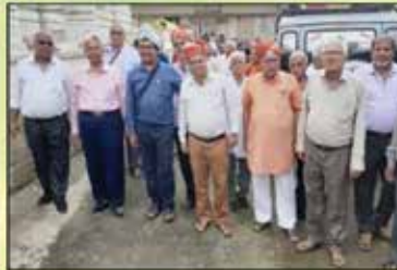
શેરડી - ભવ્ય સામૈયું