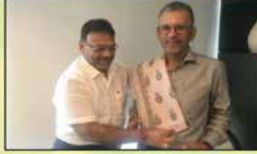
મુખ્ય દાતાશ્રી પરિવારનું બહુમાન