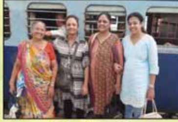
યાત્રિકો બાંદરા ટર્મિનલ