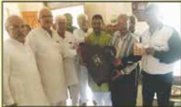
સંભારણા રૂપે બેગ અને સંઘપૂજનના કવર