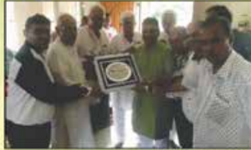
સહાયક દાતાશ્રી પરિવારનું બહુમાન