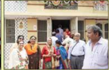
ભુજપુર - શ્રી જિનેન્દ્ર જ્યોતિર્ધામ મંદિર