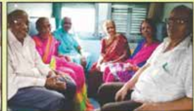
યાત્રાનો આનંદ માણતા યાત્રિકો