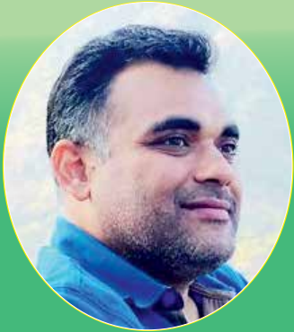
નીશિથ આનંદ દંડ