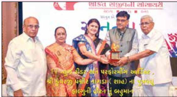
૧૫ પુસ્તક એડર અને પરિવારમીંગ આર્ટિસ્ટ, શ્રી કેમરજી મશ્હૂર નાશડા ( શાહ ) ના પુસ્તકો હાલુની હોદ્દા નું બહુમાન