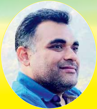
નીશિથ આનંદ દંડ