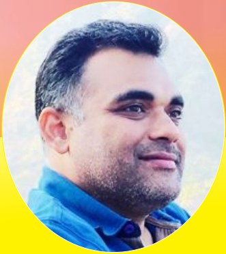
નીશિથ આનંદ દંડ