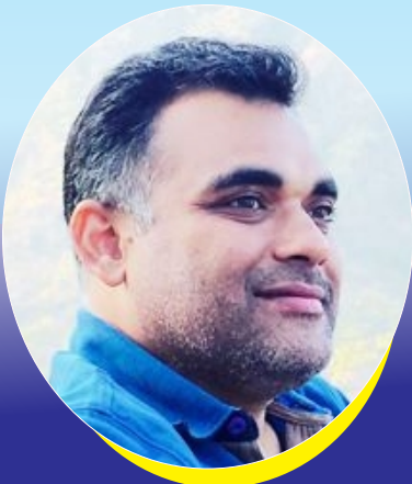
નીશિથ આનંદ ઇંડ